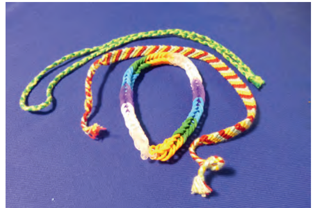
Freundschaftsbänder. Auch aus Loopies-Gummiringen geknüpft.

Material: Holzbrett 50 x 8 cm, Holzdübel Durchmesser: 8 mm, Holzleim. Verschieden farbiges Garn, je nach Geschmack.