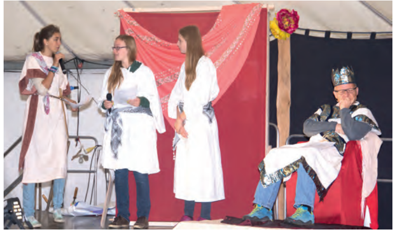
Der junge David kommt an den Königshof

Diener Gerson ( nachdenklich ): Was mach' ich nur? König Saul geht es sehr schlecht. Er ist so traurig. Schon seit Tagen hockt er nur auf seinem Thron und guckt vor sich hin. Salusch, hast du eine Idee, wie wir ihm helfen können?