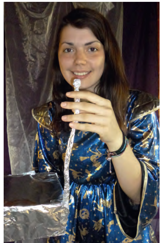
Filea spricht in ihr Philototron.