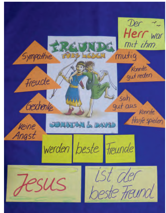
So könnte das gemeinsam erarbeitete Freundschaftsplakat aussehen.

Ein Freundschaftsband zeigt die Freundschaft von zwei Freunden/Freundinnen. Besonders schön ist es, wenn zwei genau die gleichen Bänder tragen, um ihre Freundschaft zu zeigen.