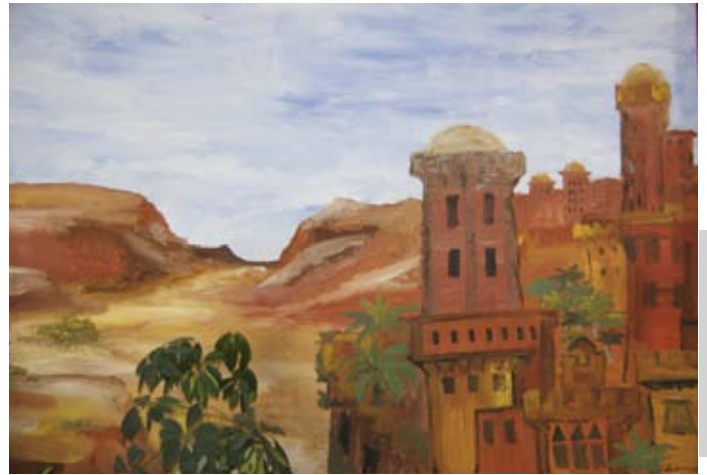
Ein auf Papier (Zeitungsrollen) oder Leinwand gemaltes Hintergrundbild schafft Atmosphäre und hilft den Kindern in die fremde Welt einzutauchen.

König: Jawohl! Soldaten, werft sie aus dem Palast! Und sucht mir eine neue Königin, eine, die es wert ist, meine Königin zu sein!