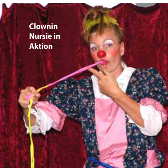
Clownin Nursie in Aktion

sowie Texte und Bilder für Werbeflyer auf Anfrage oder ab Mitte Mai unter www.kircheunterwegs.de im Internet. mz/eh