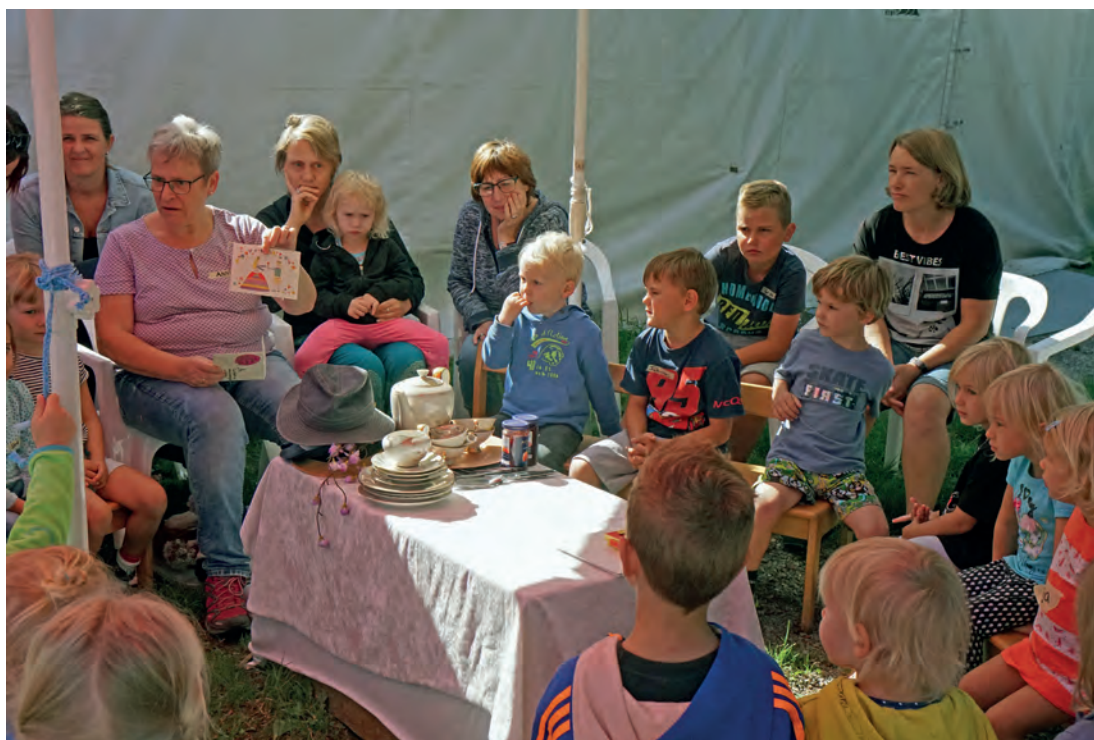
Kinder und Eltern sind fasziniert von der großen Einladung ...

Insgesamt ist die Mappe geprägt von einer Fülle an Praxisideen, die Sie gerne als Steinbruch und Ideenpool verwenden dürfen. Lassen Sie sich inspirieren und vielleicht entwickeln Sie in Ihrer Einrichtung oder in Ihrer Gemeinde mit Ihren Kindern ganz eigene Ideen. Ganz egal ob Sie nur zwei oder drei Tage zur Gestaltung haben oder sich über einen längeren Projektzeitraum mit dem Thema beschäftigen möchten, möge Gott Sie in allem Planen und Tun segnen und begleiten. Wir wünschen Ihnen viel Freude bei der Arbeit mit den Kindern und gute Erfahrungen mit der vorliegenden Praxismappe.