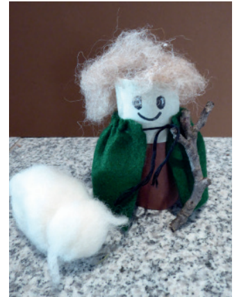
Einen Hirtenbub basteln aus Restmaterialien ...