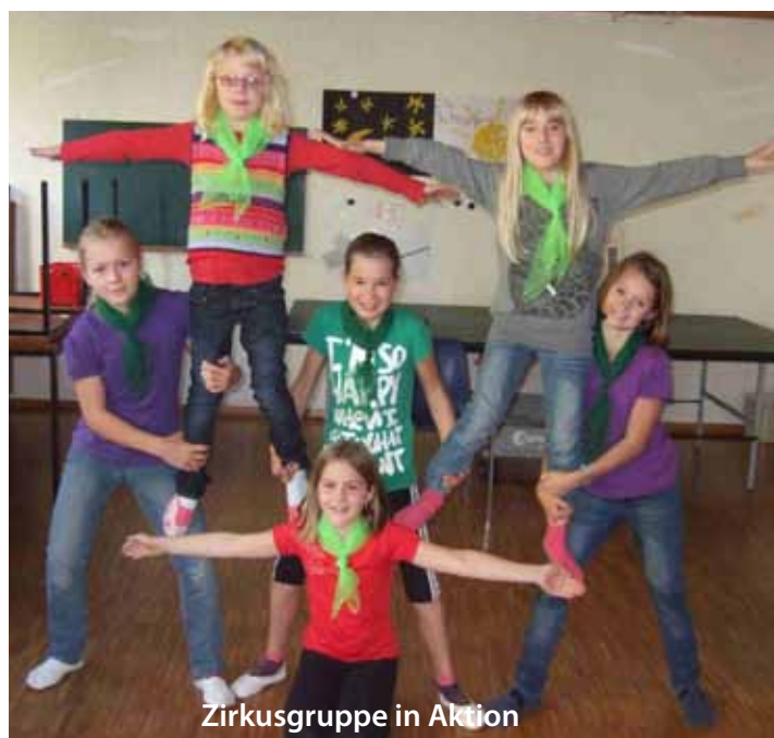
Zirkusgruppe in Aktion